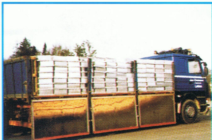
En af lastbilerne med mink.

Minkene var blevet opkøbt af to minkfarmere fra Grækenland hos Farm Food i Løkken. De ca. 4.000 mink var allesammen hunner, som var drægtige. De skulle føde ca. 10 dage efter afsendelse fra Danmark, for netop på det tidspunkt er der mindst risiko for, at hunnerne aborterer.