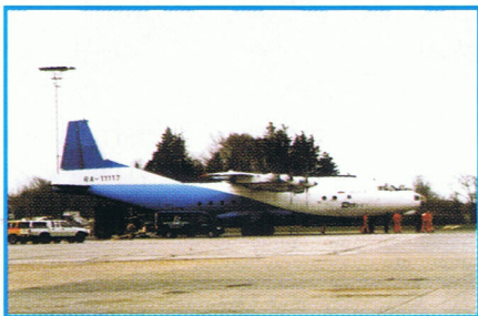
Flyet fra Rusland ankommer.

LEMAN Billund havde fået til opgave at sende ca. 4.000 drægtige mink og 40 sølvrvæve til Grækenland via vores agent Best Quality Service.