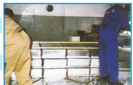
Man sørger for at skabe luft mellem minkene ved hjælp af trællister.

Det bedste ville være at bruge to mindre fly til den lille lufthavn grundet transittiden, men omkostningerne ville så også stige med ca. 20.000 USD. Valget faldt på Athens lufthavn.