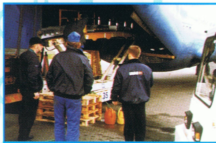
Selve læsningen af minkene (bemærk transportbåndet).

I samarbejde med vores agent i Grækenland, blev vi enige om, at der skulle chartres en AN12, en gammel russisk maskine, der kan tage 96 cbm og løfte 8,4 tons fragt. Hvorfor valget netop faldt på denne maskintype, var udelukkende et spørgsmål om pris. Det er stadigvæk langt billigere at chartre en flyvemaskine via et russisk luftfragtselskab end via et europæisk luftfragtselskab.