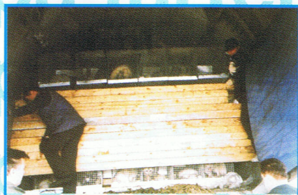
Afsikring af minkene inden den endelige afgang.

Så kom endelig dagen, hvor minkene skulle sendes af sted. Jeg skulle mødes med minkfarmeren fra Farm Food kl. 10.00 i Ålborg lufthavn, så vi kunne lægge en plan sammen med portørerne i Ålborg lufthavn. Flyet skulle lande ca. kl. 09.30 og ifølge planen lette igen kl. 11.30. Da jeg ankom kl. 09.30, var to ud af de fire lastbiler med minkene allerede ankommet og klar til at blive læsset om bord på flyet. Flyet landede kl. 10.00, og vi begyndte at forberede læsning af minkene.