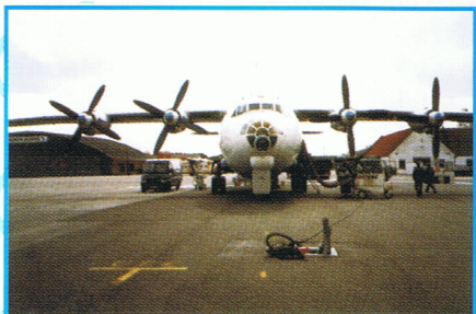
Flyet klargøres for afgang til Athen lufthavn.

Det gik (forholdsvis) planmæssigt med læsningen i starten, og vi holdt læsse-