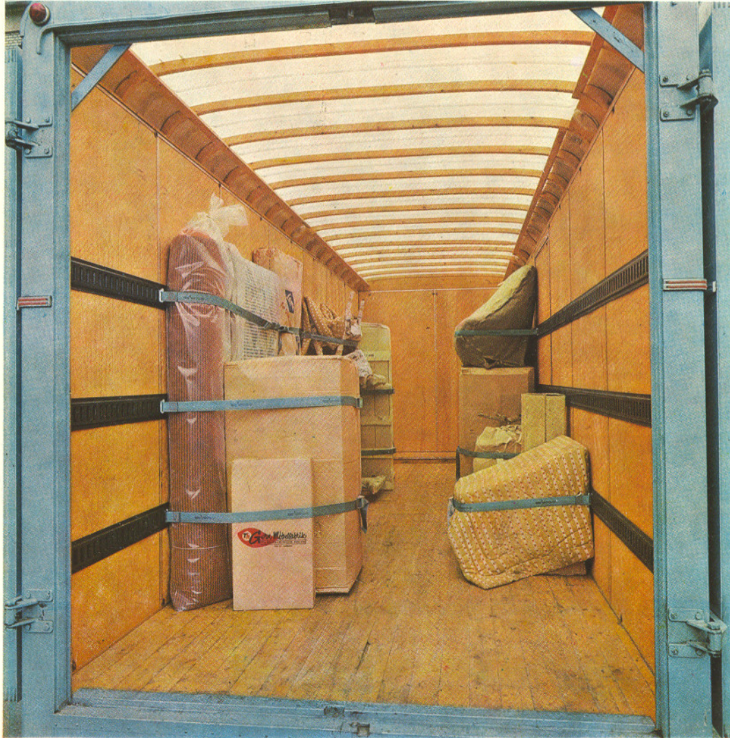
Aeroquip bus interieur